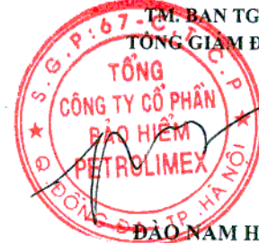
VƯƠNG QUỐC HƯNG