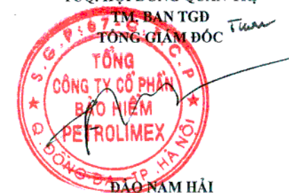
Đ. Đ. Đ. TP. HÀ NỘI